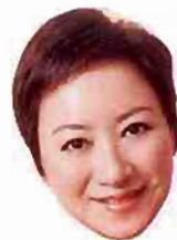
謝寧力撐本地良心貨