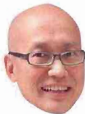
熾哥帶你踩入批發鋪歡吉頭鮑