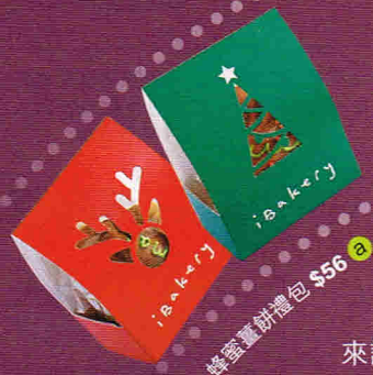
蜂蜜薑餅禮包 $56 a