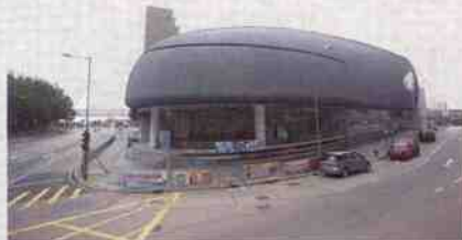
有西環水立方之稱的堅尼地城泳池，去年落成，地址是西洋街北 2 號。