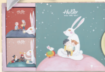
「陳皮豆沙·蛋黃白蓮蓉」雙式月餅禮盒 預訂優惠價$168 (原價$188)